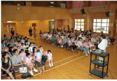
小一選校講座的情況。