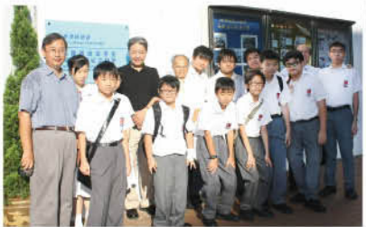
戎會長、李校長與「優材課程」的暑期班同學合照。