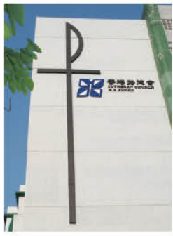
呂祥光小學外牆的會徽