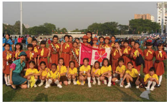
出席「全港優秀小女童軍團隊」頒獎典禮情況。